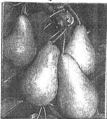
Hrušeň zimní : Astra, Bohemica

Z hrušní – Clappova – je letní máslovka, dozrávající v polovině srpna. Veliké světle zelené plody, navinule sladká dužnina, velmi dobrá. Podzimní hrušně Boscova Lahvice, Konference, Jana.