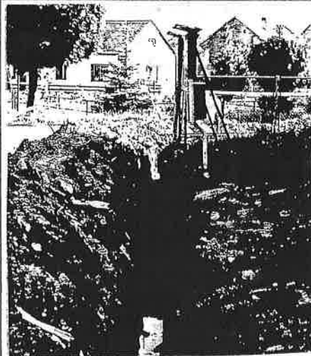
Snímek se vracíme k plynofikaci Bílé Lhoty.

tlakého vedení a dále středotlak na výše jmenované obce. Se zahájením stavby se počítá na jaře roku 2001 s tím, že v tomtéž roce bude ukončena. V měsíci srpnu bude podána společná žádost všech zúčastněných obcí na Státní fond životního prostředí o dotaci stavby.