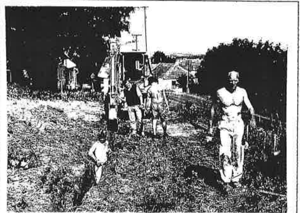
Práce na zásobovacím řádu v Bílé Lhotě

vodovod. Termín ukončení přihlášek žadatelů o připojení na veřejný vodovod byl vzhledem k nutným úpravám trasy zásobovacího řádu stanoven do 30. září 1999 Ke dnešnímu dni jsou ukončeny práce na domovních přípojkách v Řimicích a dne 6. října 1999 budou oficiálně přebrány zástupci obce a provozovatelem k užívání.