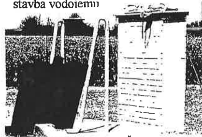
Cerpací stanice Řimice

Pateří do Hradečné, kde zůstává stavba vodojemu