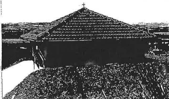
Vodojem „Řimice“, před kolaudací.

závisí na zajištění dodatečných finančních zdrojů. A o to se v současné době snažíme. Není třeba snad připomínat co to v dnešní době, v tomto státě znamená. I informace z jednání vlády ČR nejsou nijak nadějně.