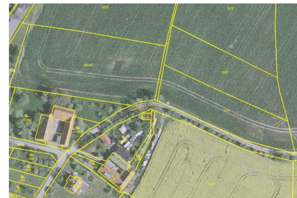
Ortofoto s obrazem katastrální mapy po obnově katastrálního operátu

Po skončení prací na obnově katastrálního operátu dochází k vyhlášení jeho platnosti. Podle § 62 odst. 2 katastrální vyhlášky (č. 26/2007 Sb.), zašle katastrální úřad sdělení o vyhlášení platnosti obnoveného katastrálního operátu obci, na jejímž území byl katastrální operát obnoven. Vyhlášení platnosti zveřejní katastrální úřad v součinnosti s obcí podle § 62 odst. 3 katastrální vyhlášky. Katastrální úřad a Český úřad zeměměřický a katastrální zveřejní vyhlášení platnosti obnoveného katastrálního operátu rovněž na svých internetových stránkách.