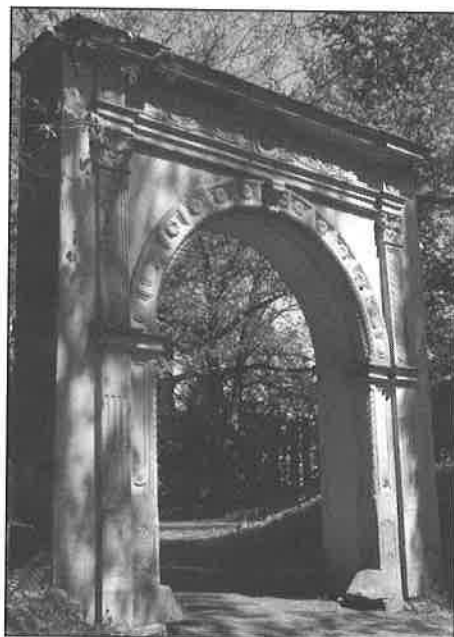
◀ Renesanční portál - původní a současné umístění.